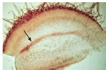
fig 2 Medulla in A. nigricans (zie pijl). van de vondst in Arnhem (Menno Boomsliuter)