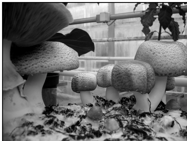
De gekweekte Amandelchampignon ( Agaricus brasiliensis ).

van Cordyceps sinensis van dezelfde firma wordt aangeprezen als Core-D-Ceps Energy, maar het etiket toont dezelfde paddenstoel! Het toppunt is echter een medicament van Hawaiian Health Products , aangeprezen als "pure mushroom powder" van de Royal Sun Agaricus. Zoals op bijgaande foto is te zien, toont het etiket een witte paddenstoel, compleet met ring, beurs en knol, die in niets herinnert aan de Amandelchampignon, maar wel als twee druppels water lijkt op een dodelijk giftige Knolamaniet!