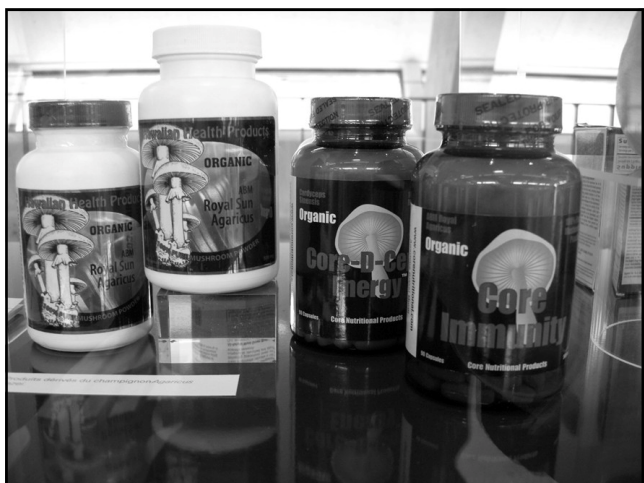
Myco-medicijnen in uitstallkast te MYCORAMA, Cernier bij Neuchâtel, Zwitserland.

dieren! Onder de preparaten bestemd voor de trouwe viervoeters vinden we een Immune Assist for dogs en zelfs een door Stamets' Fungi Perfecti aangeboden MUSH, a medicinal mushroom dietary supplement for pets . De heren fabrikanten weten hun markt wel uit te breiden... Bij diezelfde stand wordt het ons ook duidelijk dat er nogal wat ontbreekt aan de mycologische kennis van zowel handelaars als consumenten. Het etiket van ABM Royal Sun Agaricus van Core Nutritional Products toont een bleke, op een Voorjaarsridderzwam lijkende paddenstoel, waar met grote letters Core Immunity overgedrukt staat. Een preparaat op basis